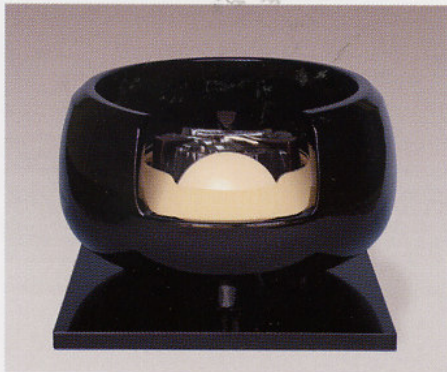
F423 真塗道安(小) (面取り)

径: 31cm・高さ: 18cm 100V/400W 〈付属品一式〉真塗敷板 まえかわらけ 灰型付 切替中間スイッチ付 (200W・200W・400W)