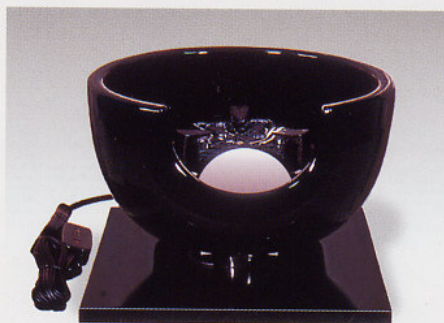
F406 真塗(紅鉢型) お炭点前 使用可能

径: 29cm・高さ: 31cm 100V/400W 灰型付 〈付属品一式〉志きの釜・釜かん まえかわらけ 真塗敷板 切替中間スイッチ付 (200W・200W・400W)