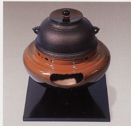
F402 合金製 朝鮮風炉(古銅色)

径: 30cm・高さ: 33.5cm 100V/400W 灰型付 〈付属品一式〉志きの釜・釜かん まえかわらけ 真塗敷板 切替中間スイッチ付 (200W・200W・400W)