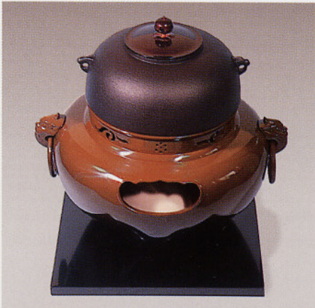
F401 合金製 鬼面風炉(古銅色)

※付属品の有無の記号 ◀は香入付 ▶はコード付、風炉には付属品として敷板・まえかわらけ付。一部の風炉には、