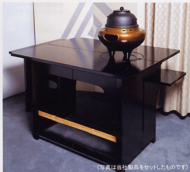
(写真は当社製品をセットしたものです)