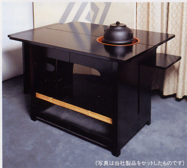
(写真は当社製品をセットしたものです)